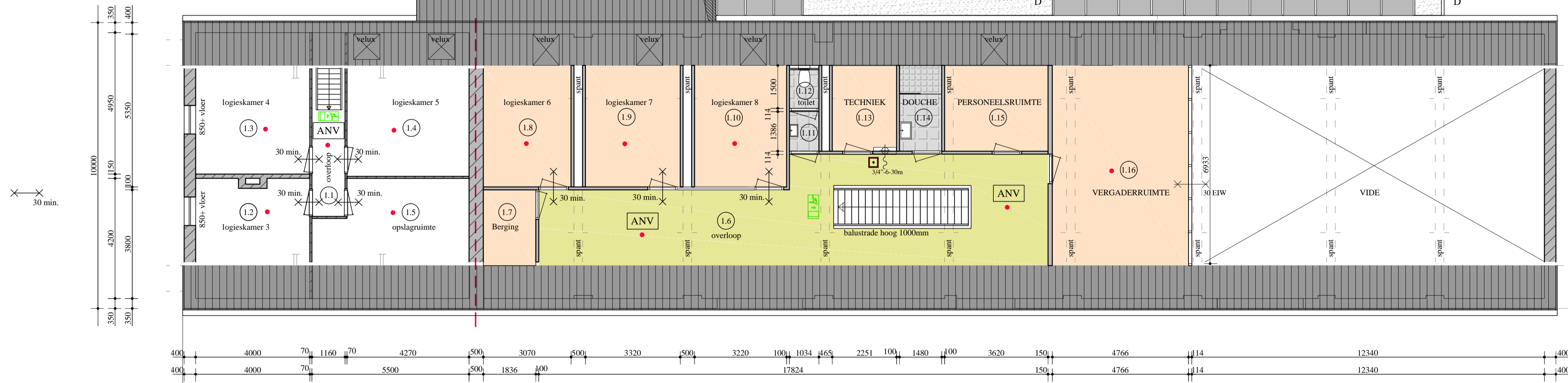
- 1e VERDIEPING -

ZUIVER MATEN IN HET WERK TE METEN EN TE CONTROLEREN