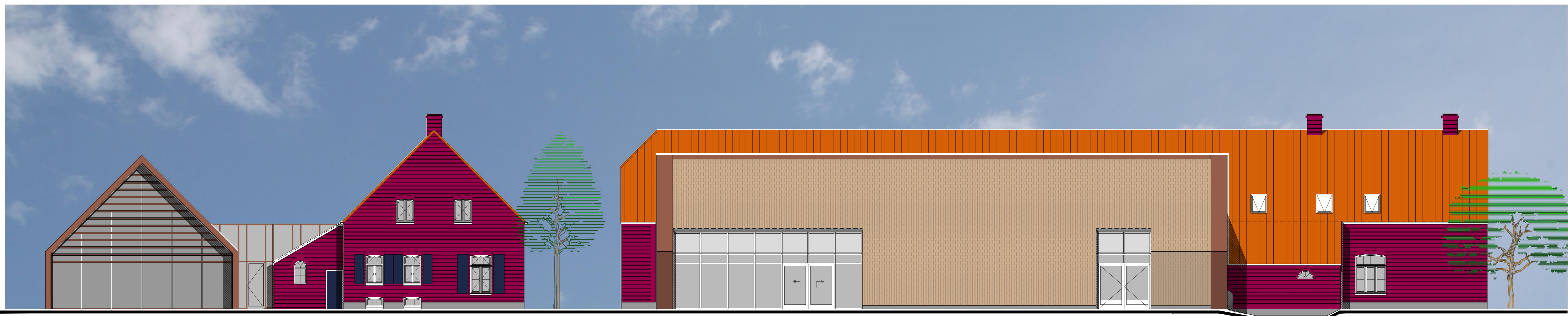
- WESTGEVEL -