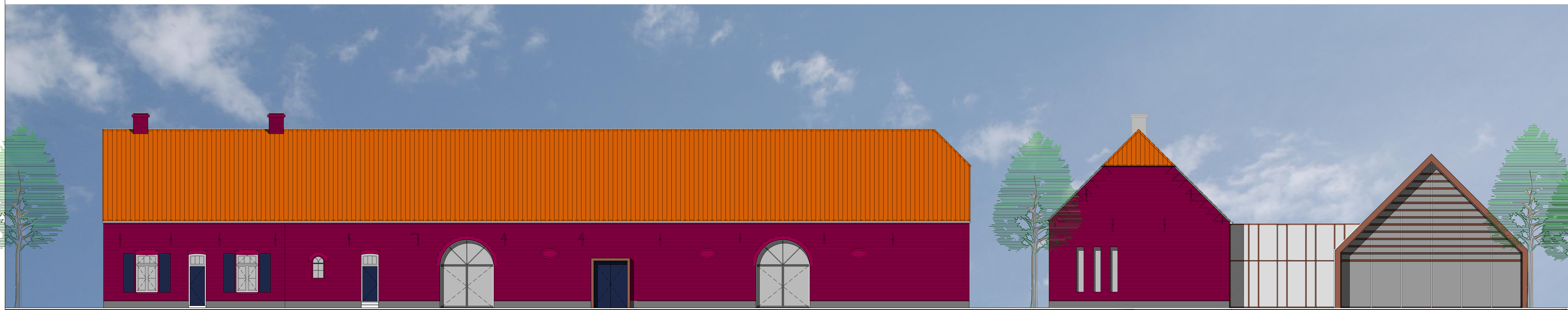
- ZUIDGEVEL -