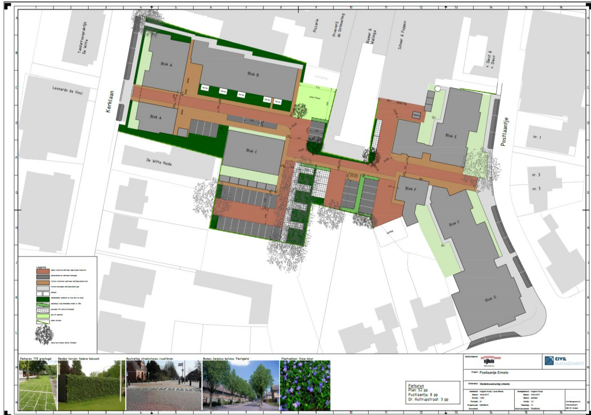
Figuur 2: Stedenbouwkundig ontwerp van de nieuwe situatie