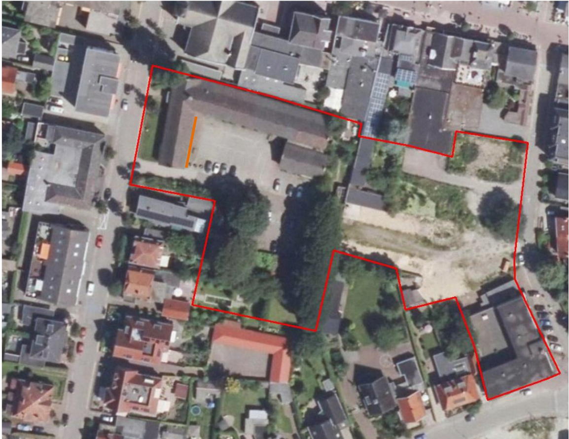
Figuur 1: Locatie waar de zes nesten van de Huismus zijn vastgesteld waarop dit besluit betrekking heeft (oranje lijn), binnen het plangebied Kerklaan – Postlaantje (rode lijn) te Ermelo