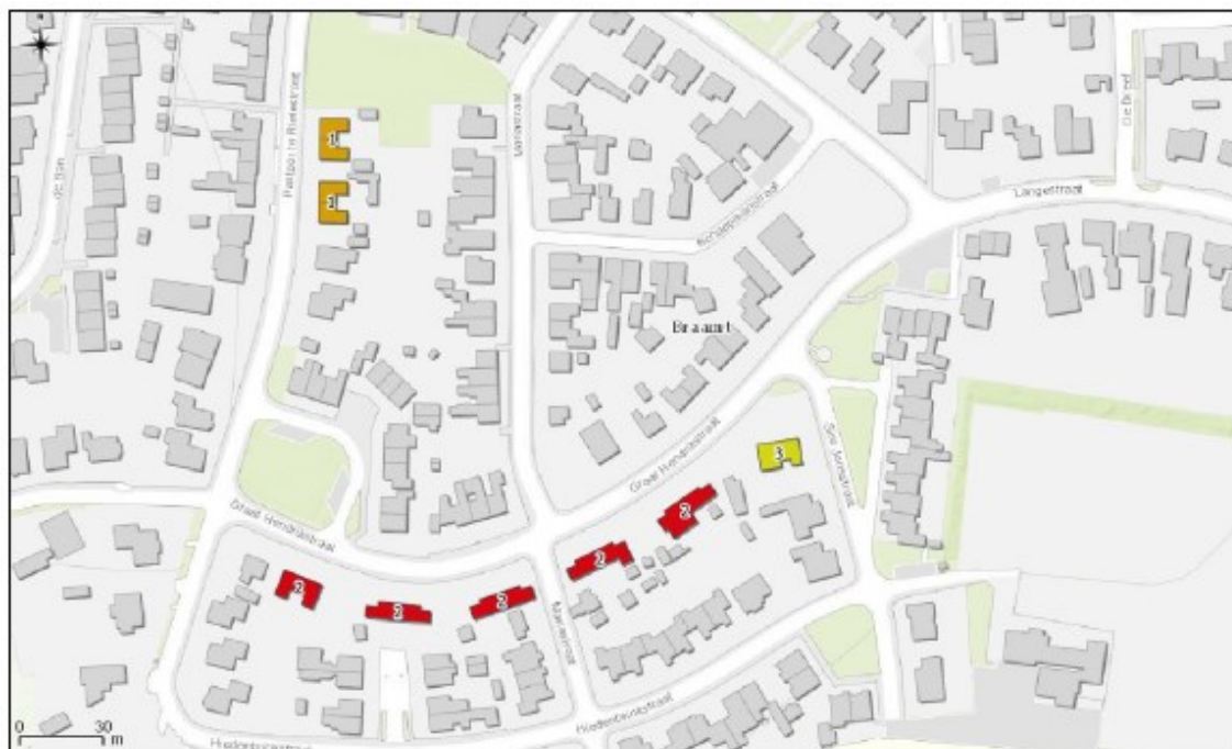
Figuur 2. Onderzoekslocatie en directe omgeving. De woningen aangeduid met 1 worden gerenoveerd, 2 worden gesloopt en 3 worden verkocht.