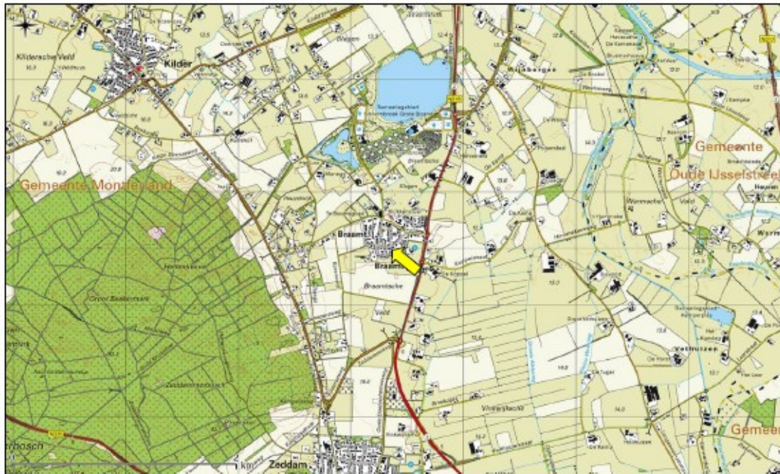
Figuur 1. Topografische ligging van de onderzoekslocatie.