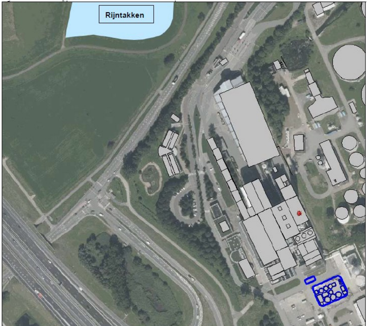
Figuur 1 De grijze vlakken betreffen de in gebruik zijnde gebouwen van het bedrijf; de blauwe lijnen betreffen de locaties van de CO 2 -plant en de balenopslag.