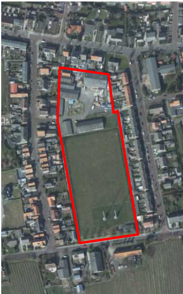
Afb. 1. Bestaande gebied, met begrenzing plangebied

De ontwikkellocatie is gelegen tussen de straten Bonzijweg (Zuid), Molenstraat (Oost), Prinses Beatrixweg (Noord) en Oranjeboomstraat (West). Dit gebied is nu aan de noordzijde in gebruik als klein bedrijventerrein met een viertal loodsen en twee garageboxcomplexjes. Het overige gebied is een groot grasveld, waarvan de zuidzijde wordt gebruikt door de boogschuttersvereniging. Hiervoor staan twee masten (staande wip) en een klein clubhuis.