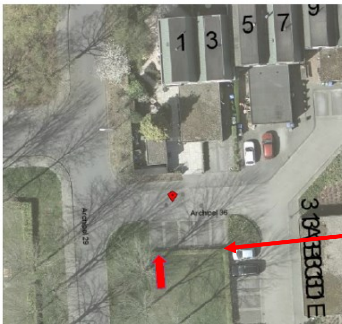
Tekening bij verkeersbesluit (175344126) E-oplaadplaats Archipel 36 ter hoogte van nummer 1, registratienummer 175344129