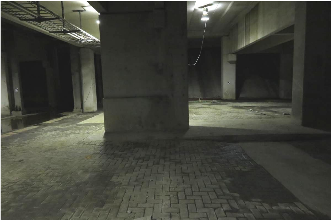
Figuur 2. Aanzicht van het plangebied aan de voormalige bietenopslag te Dinteloord.