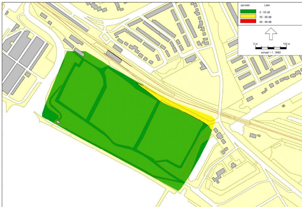
Figuur 4.4: Lden railverkeer – Hoekse Lijn