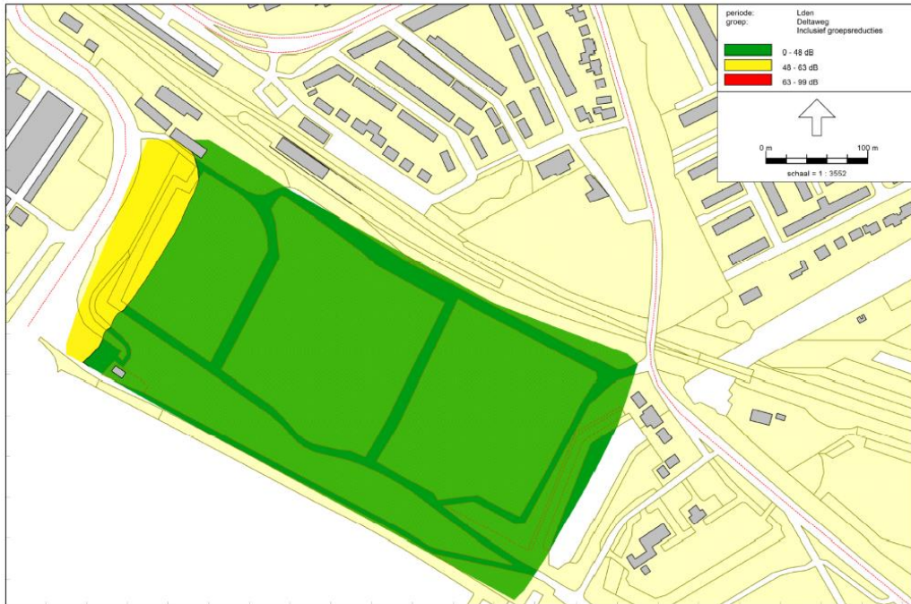
Figuur 4.3: Lden Deltaweg excl. aftrek art. 110g Wgh