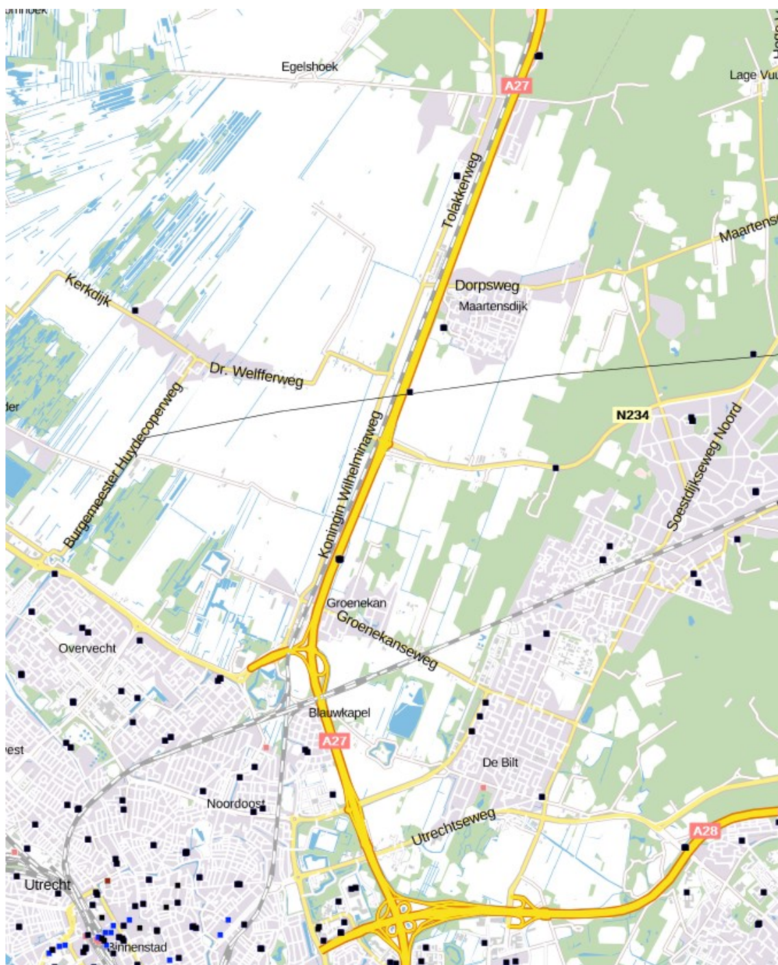
Figuur 1: Locatie huidige antenne-installaties op basis van site-sharing