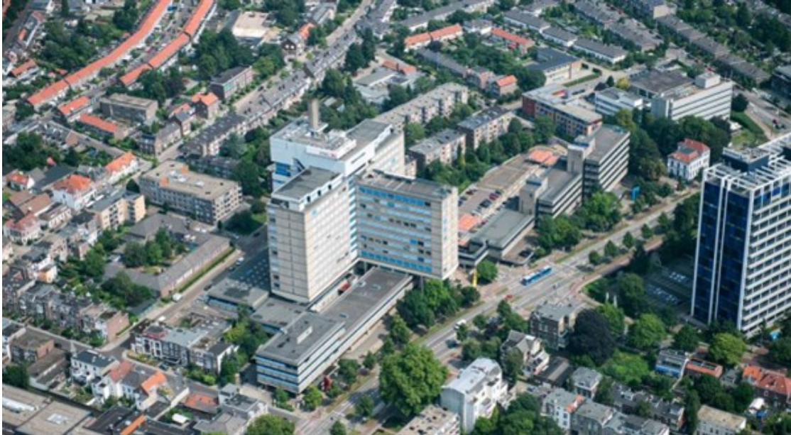
Afbeelding 1: Globale ligging (luchtfoto) en indrukken van het voormalig ING-gebouw aan de Velperweg 45-49 te Arnhem. Werkzaamheden zullen in eerste instantie plaatsvinden aan "het kruis". Rechts op de foto is het AKZO-gebouw deels te zien.