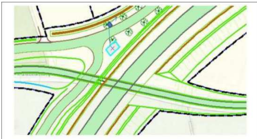
Figuur 1.1: Overzicht Fietstunnel Klarenbeekseweg.