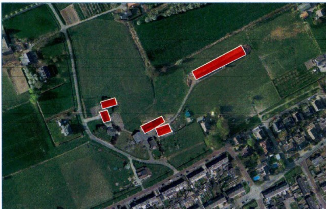
Figuur 2. Luchtfoto van het plangebied (rood), bron: Provincie Gelderland, 2017.