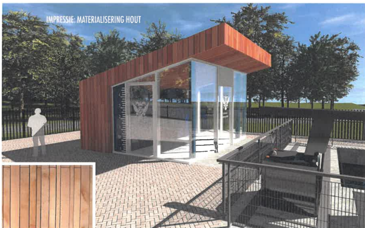
Afbeelding 4: Impressie van het permanente gemaal.

Maatregel 2- Vergroten capaciteit hoofdwatgang (Tekeningnummer: 2017-0207)