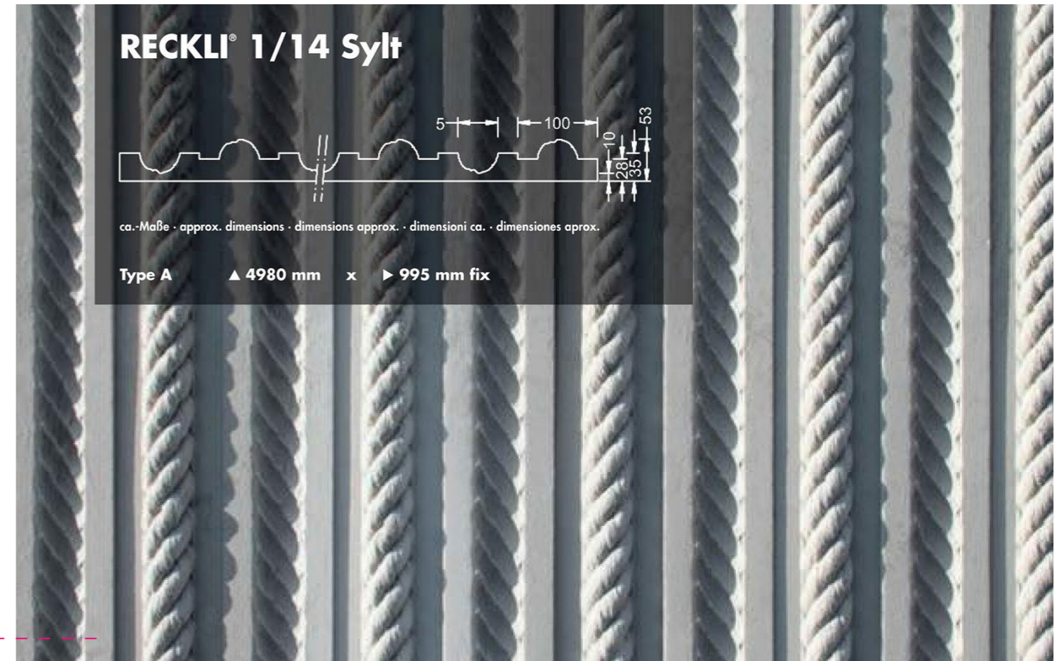
betonelementen voorzien van figuratie; refererend naar gebruik garen/touw in de confectiefabriek