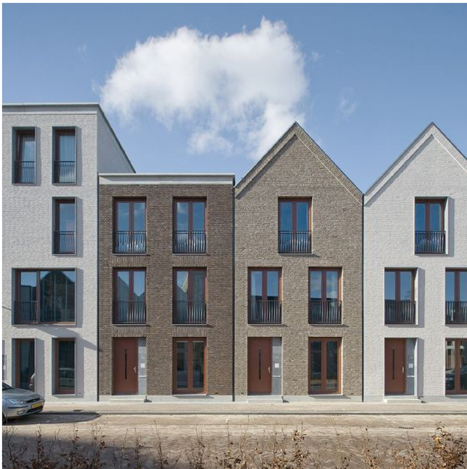
Metselwerk gevel, opbouw met plint en dakrand, subtiele details in metselverbanden, pand als losse entiteit afleesbaar.