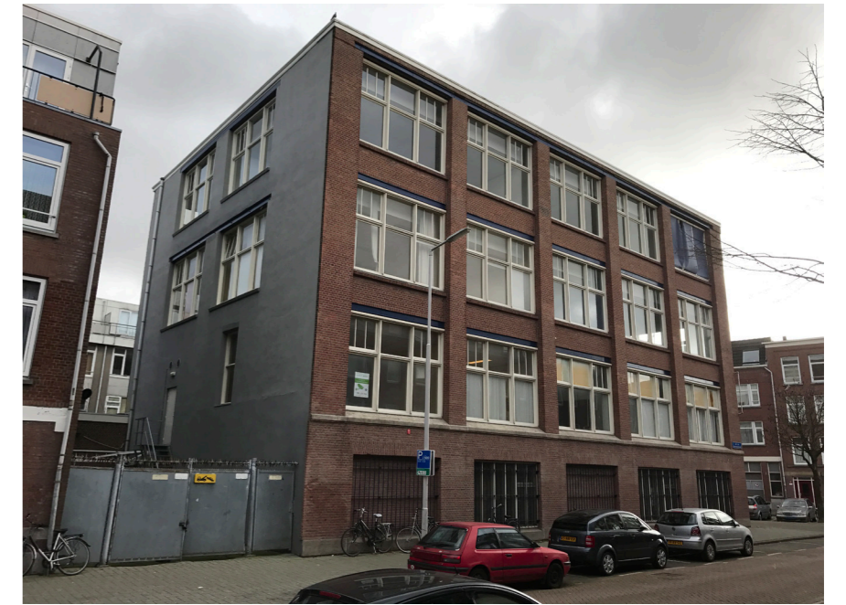
Bestaande situatie; hekwerk en wachtgevels zijn geen kwaliteit.