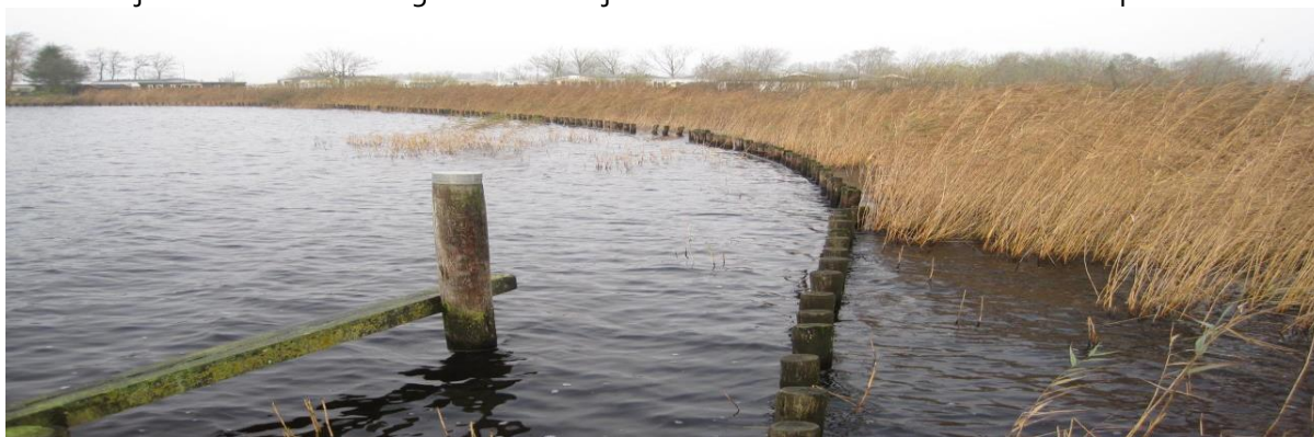
Figuur 2.1 Impressie van het plangebied

Het plangebied ligt voor een groot deel in het Sneekermeer en grenst in het noorden aan het Waterpark de Zoutpoel (figuur 2.2). Het plangebied bestaat uit het dijklichaam met daarop een half-verhard fietspad. Tussen het dijklichaam en het open water van het Sneekermeer bestaat het gebied uit een strook onbemalen boezemland bestaande uit grasland, enkele lage wilgen en verruigd rietland (zie foto figuur 2.1). Plaatselijk reikt het open water nagenoeg tot aan de kade en is nauwelijks voorland aanwezig. De oevers zijn beschoeid met steenstort en houten palen.