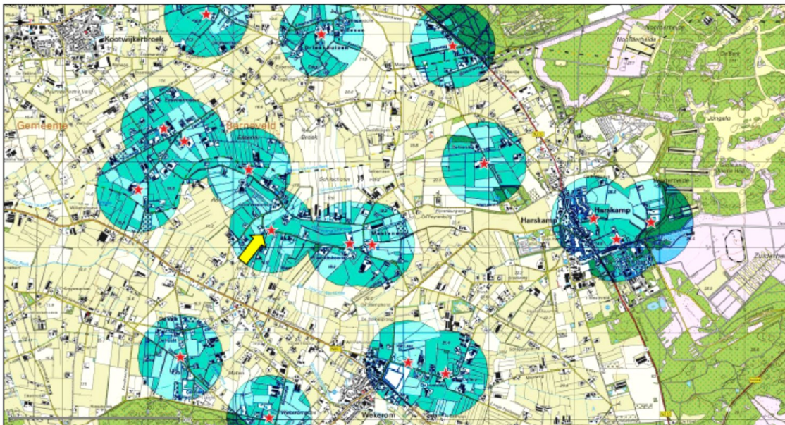
Figuur 5. Situering bezette kerkuilenterritoria (rode ster) volgens De uilenvlucht, 2016, aangevuld met gegevens uit projecten van Econsultancy. De cirkels rond de nestkasten hebben een straal van 500 meter. Met een gele pijl is de kast op de onderzoekslocatie aangegeven.