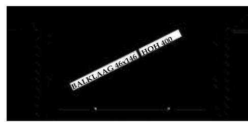
Balklagen schaal 1:50