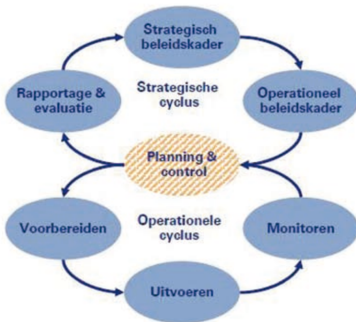
Figuur 1: 'The Big Eight'

moeten worden. Op deze wijze kan aan het bestuur periodiek en adequaat verantwoording worden afgelegd ('rapportage en evaluatie').