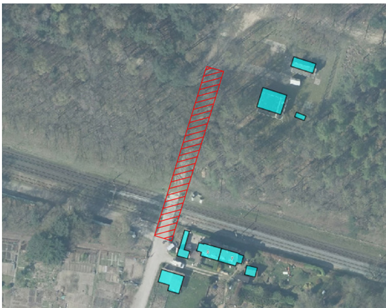
Afbeelding 2: Luchtfoto huidige gelijkvloerse spoorwegovergang

Met het voorliggende onttrekkingsbesluit wordt de bestaande gelijkvloerse spoorwegovergang naar het bosgebied Sysselft opgeheven. Deze spoorwegovergang ligt ten oosten van de stationsomgeving direct naast de woningen dr. Hartogsweg 5 en 7, kadastraal bekend gemeente Ede, sectie C nummers 2413, 3427, 3429, 3430 (allen gedeeltelijk).