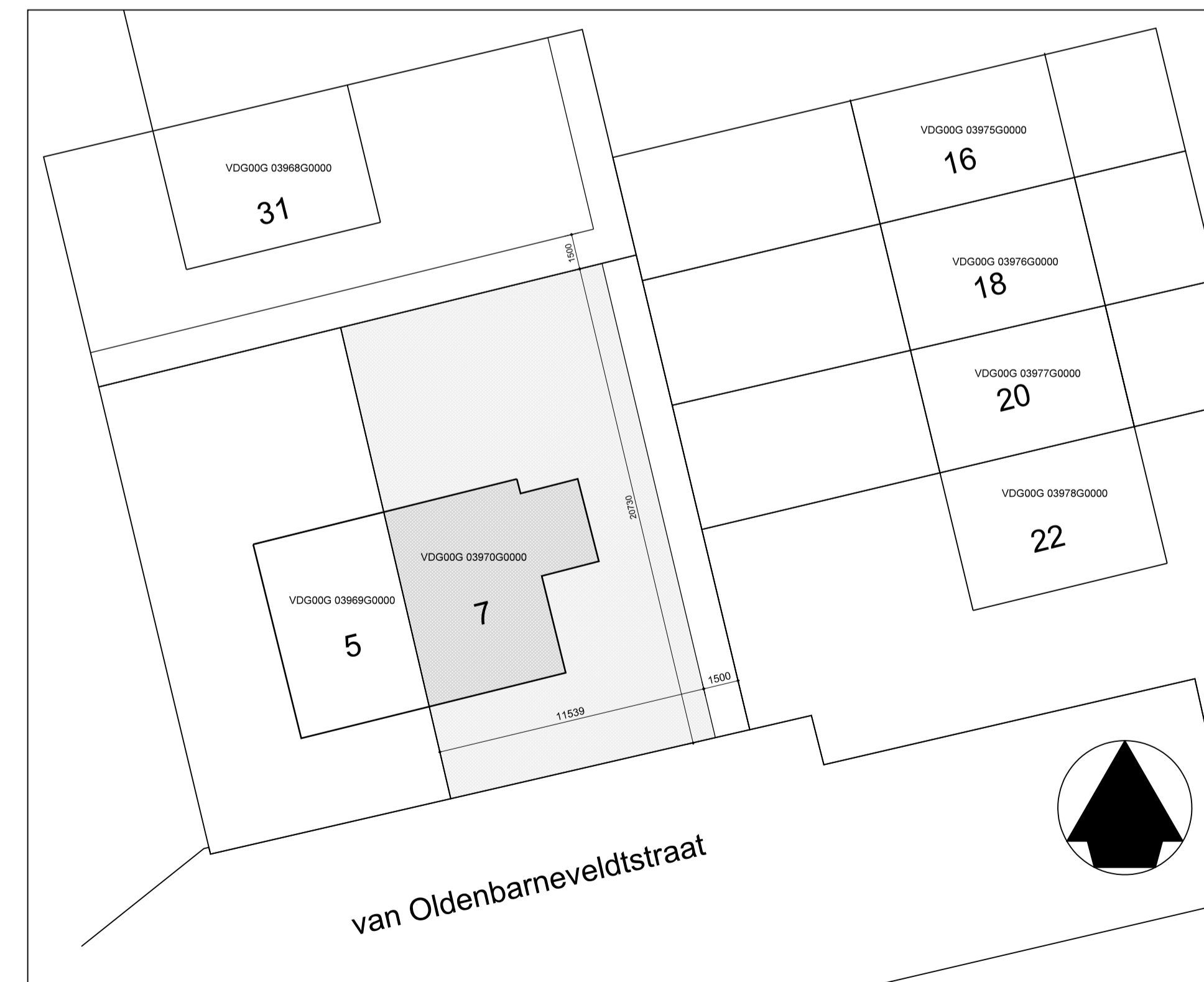
situatie schaal 1:200 Vlaardingen G 3970