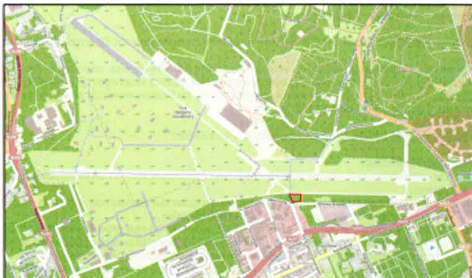
Figuur 1 Ligging plangebied (rood omlijnd) (ondergrond: Data by OpenStreetMap.org contributors under CC BY-SA 2.0 license).

De pleisterplaats wordt aangelegd op de voormalige vliegbasis Soesterberg. De toegang tot de pleisterplaats komt nabij de kruising van de Batenburgweg en de Veldmaarschalk Montgomeryweg te Soesterberg. De locaties zijn weergegevens in de figuren 1 en 2.