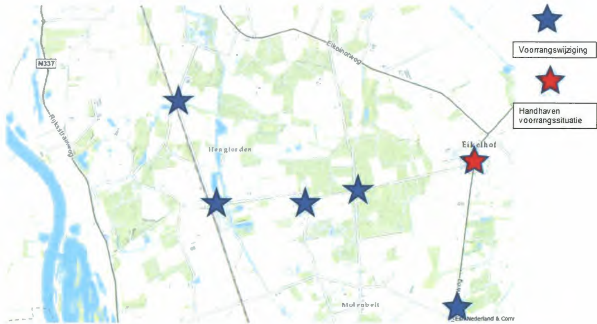
Bijlage 1: Situatietekeningen behorende bij het verkeersbesluit.