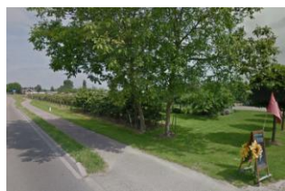
zicht op het plangebied vanaf Van der Mondeweg

Onderstaand zijn foto's van het plangebied vanaf de Van der Mondeweg en de Lage Zandsestraat opgenomen, alsmede een luchtfoto.