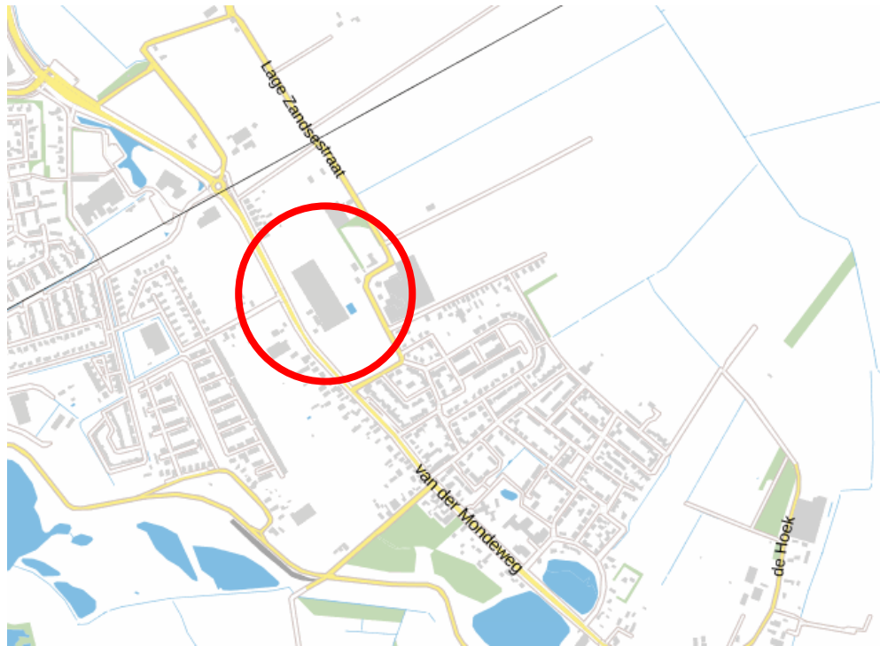
globale ligging plangebied