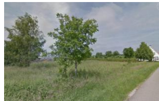
zicht op het plangebied vanaf Lage Zandsestraat