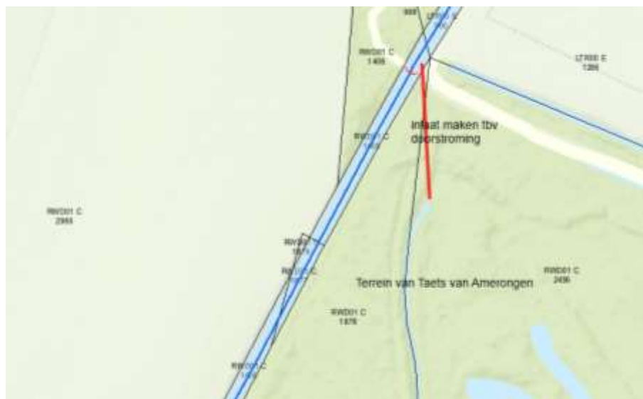
Locatie: Inlaat terrein Teats van Amerongen