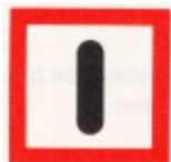
Verplicht bijzonder op te letten (BPR, bijlage 7, B.8 )