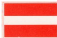
In- uit- of doorvaart verboden (BPR, bijlage 7, A.1 )

Naast deze bebording vanuit de BPR dient een informatiebord te worden geplaatst waarop is aangegeven op welke momenten doorvaart voor het scheepvaartverkeer mogelijk is.