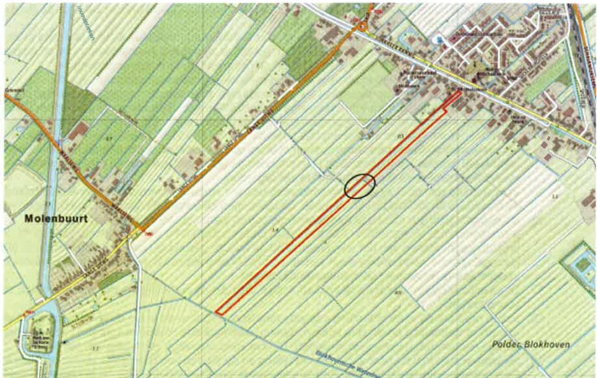
Figuur 1 | Polder Blokhoven met de globale ligging van het onderzochte plangebied rood omkaderd. Aan de noordoostzijde ligt Schalkwijk aan de zuidwestzijde zijn het Werk aan de Korte Uitweg, één van de forten van de Nieuwe Hollandse Waterlinie en het buurtschap Molenbuurt zichtbaar. De cirkel markeert de diepe watergangen.