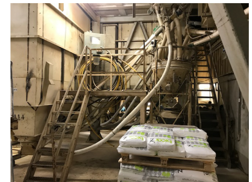
De zelfdragende silo's nr-20

Bij de aanvraag is een tekstuele uitleg toegevoegd die behoort bij deze tekening waarin de legenda is opgenomen + verklarende tekst