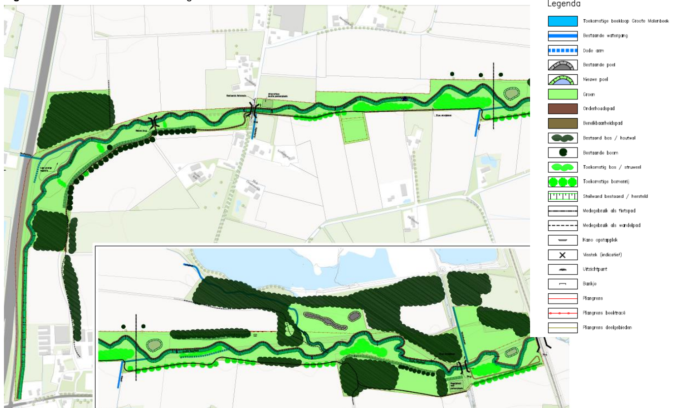
Figuur 2: Situatieschets na herinrichting

Of en waar bomen worden geveld is nog onduidelijk. Geschat wordt dat in de voorgenomen ontwikkeling 0 tot 50 bomen worden geveld. Indien bomen worden geveld gaat het voornamelijk om jonge bomen.