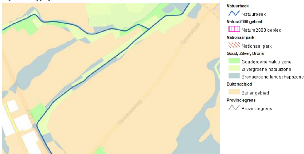
Figuur 3: Ligging Grote Molenbeek ten opzichte van natuurzones.

De Grote Molenbeek ligt in zijn geheel in de EHS en is aangegeven als een Natuurbeek. De herinrichting wordt niet uitgevoerd ten behoeve van economische functies en is gericht op herstel van de ecologische functie van de beek. De voorgenomen ontwikkeling past in de aanwijzing als Natuurbeek en vormt geen belemmering.