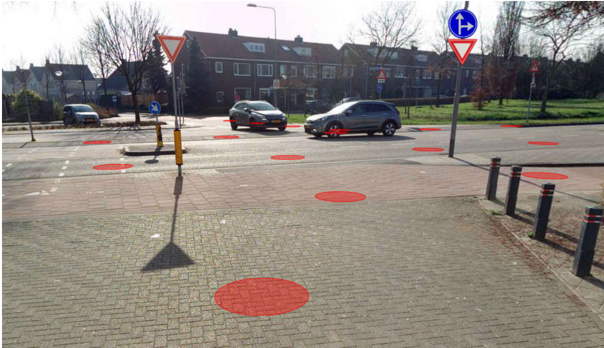
Aanbrengen bord B06 en D06r aan lichtmast