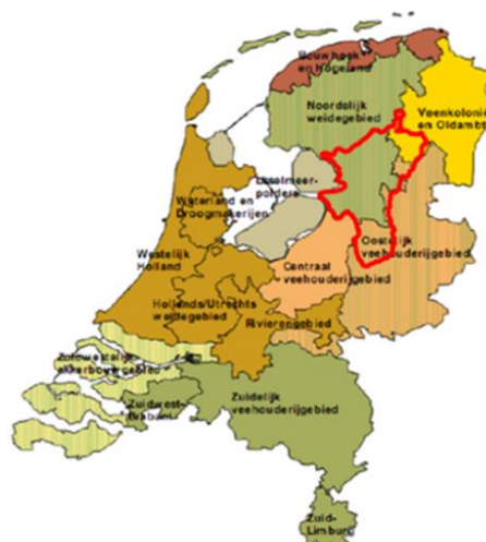
Fig. 4.1 regio's