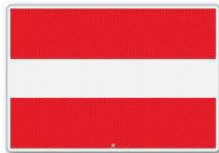
In- uit- of doorvaart verboden (BPR, bijlage 7, A.1 )