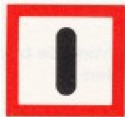
Verplicht bijzonder op te letten (BPR, bijlage 7, B.8 )