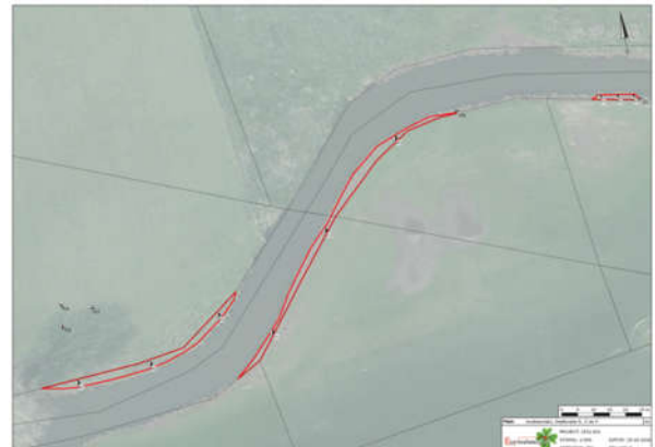
(Afbeelding 5. Voorbeeld meting deellocatie)