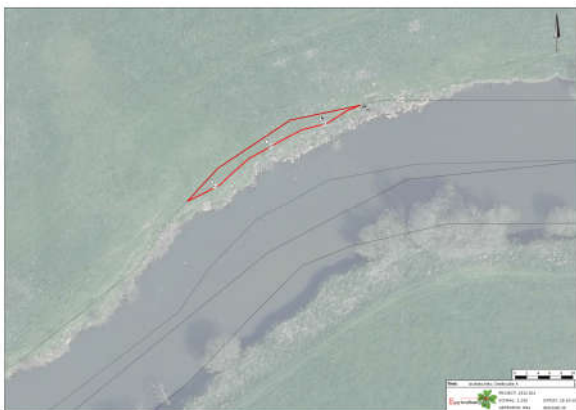
(Afbeelding 4. Voorbeeld meting deellocatie)