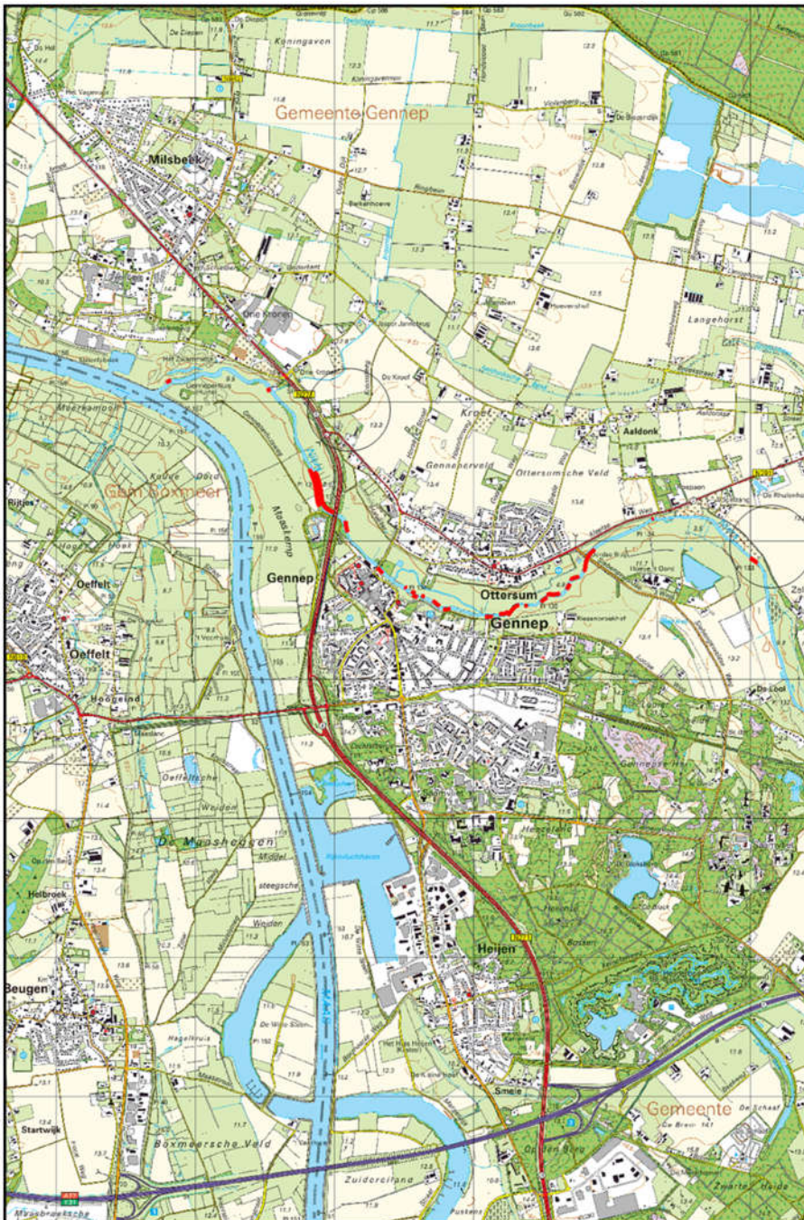
(Afbeelding 1. Topografische ligging ontgravingslocatie nabij Gennepe)

Het projectgebied is gelegen in Noord-Limburg, gemeente Gennepe. Daar waar rivier de Niers ter hoogte van het dorp Hommersum, Duitsland (deelstaat Nordrhein-Westfalen) Nederland binnen komt. De fysieke werkzaamheden zullen plaatsvinden op een 17 locaties gelegen aan rivier de Niers. (zie afbeelding 1. Topografische ligging ontgravingslocatie nabij Gennepe).