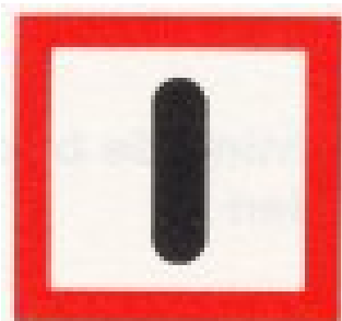
Verplicht bijzonder op te letten (BPR, bijlage 7, B.8 )