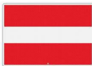
In-, uit- of doorvaart verboden tussen 20:00 en 23:30 (BPR, bijlage 7, A.1 )