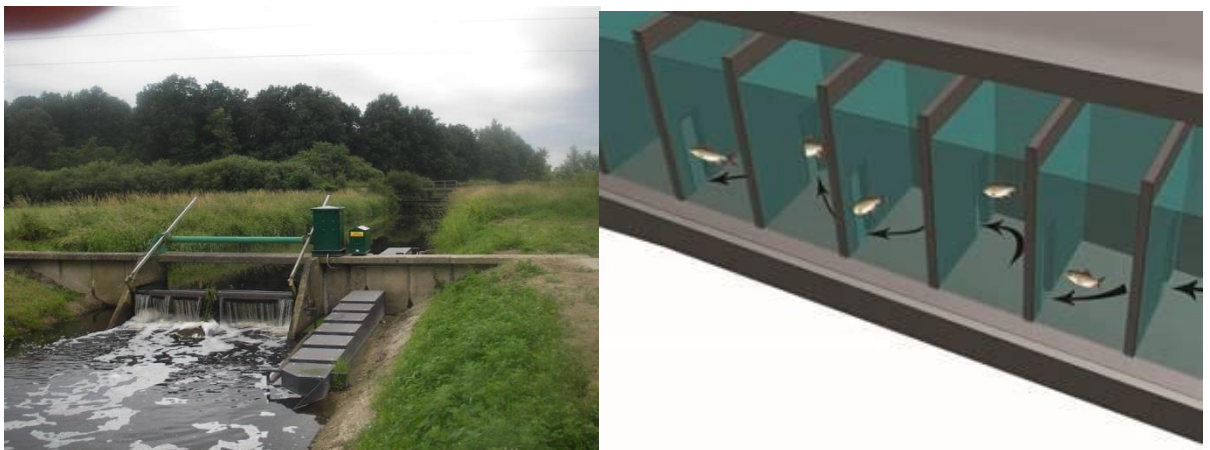
Links: referentiefoto van een De Wit vispassage langs een stuw, rechts: verspringende openingen in de vispassage

Een De Wit vispassage is een constructie die in of langs een talud kan worden aangebracht door de damwand van de stuw heen. Stuw en vispassage vormen zo een compact geheel. De De Wit vispassage bestaat uit een langwerpige, gesloten bak met binnenin tussenschotten die de bak in kamers verdelen. In ieder tussenschot is een opening (venster) aangebracht. De vensters in de tussenschotten sluiten aan op de bodem. Op de bodem van de kamers wordt een laag breuksteen aangebracht zodat een traploze bedding ontstaat. De openingen verspringen ten opzichte van elkaar afwisselend links en rechts van de lengteas van de vispassage. Hierdoor ontstaat een slingerend stromingspatroon dat zorgt voor een verhoogde energiedemping en afremming van de stroomsnelheid. De bovenkant van de vispassage is afgewerkt met afdekroosters die gedemonteerd den gelicht kunnen worden. Zo kan het binnenwerk van de vispassage eenvoudig onderhouden worden.