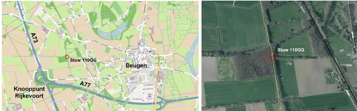
Figuur 1, en 2: links: ligging t.o.v. Beugen en knooppunt Rijkevoort; rechts: ligging stuw in het groen langs de Oeffeltse Raam

De stuw is gelegen op de volgende locatie: