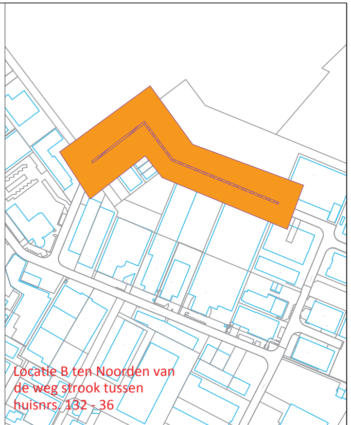
Locatie B ten Noorden van de weg strook tussen huisnrs. 132 - 36