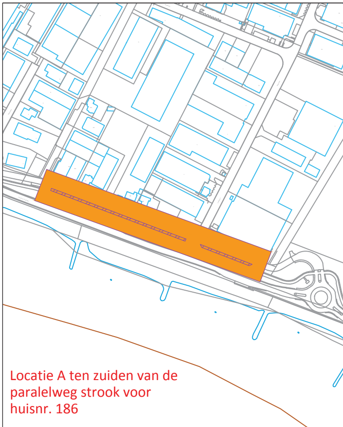
Locatie A ten zuiden van de parallelweg strook voor huisnr. 186