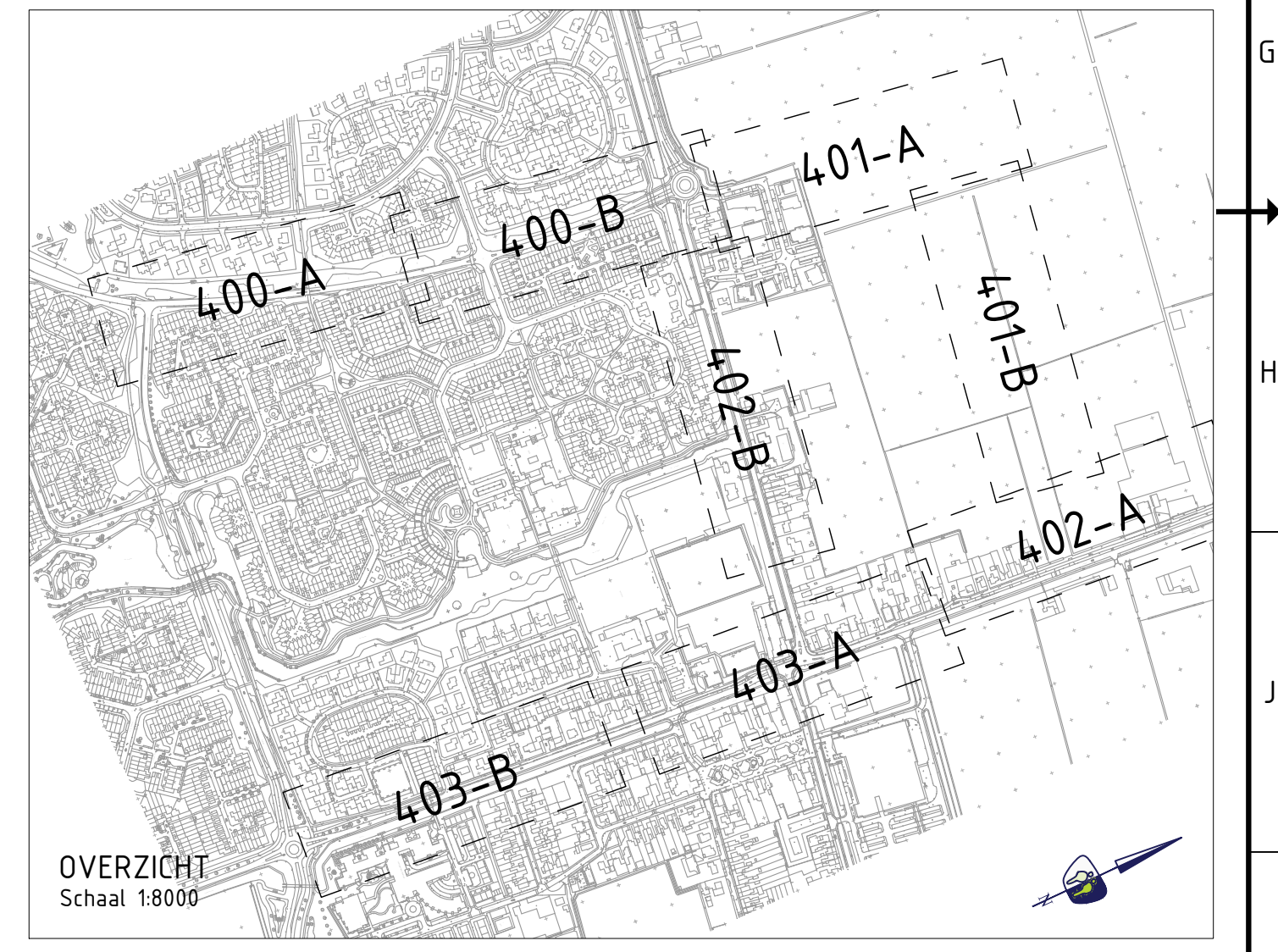
OVERZICHT Schaal 1:8000