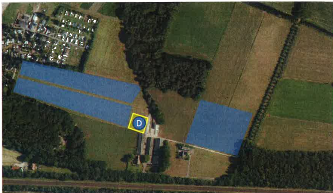
Figuur 2: locatie gronddepot (letter D)