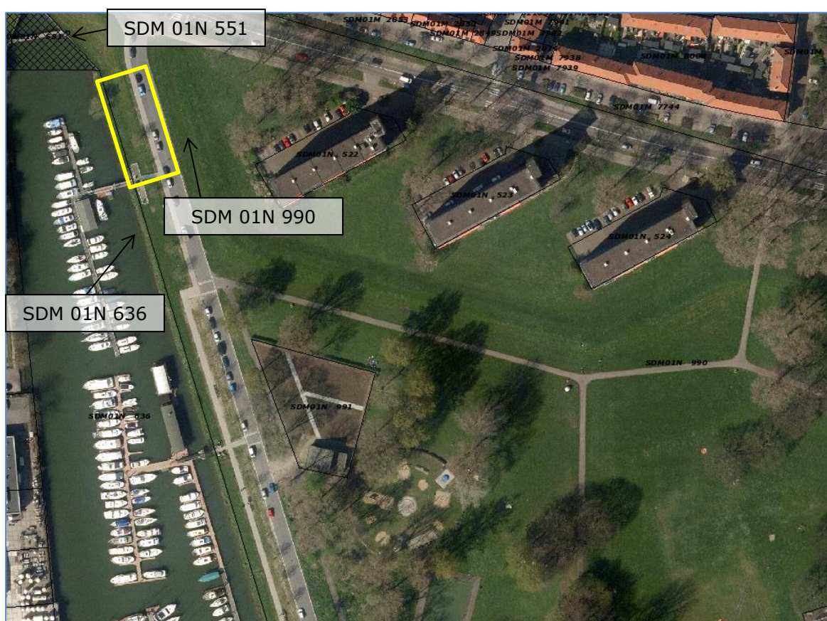
Figuur 4 Kadastrale gegevens projectgebied

De werkzaamheden, gele kader in Figuur 4, vinden plaats op eigendom van de gemeente Schiedam. Met de gemeente is afgesproken dat een schriftelijke toestemming voor het plaatsen van de damwand voldoende is.