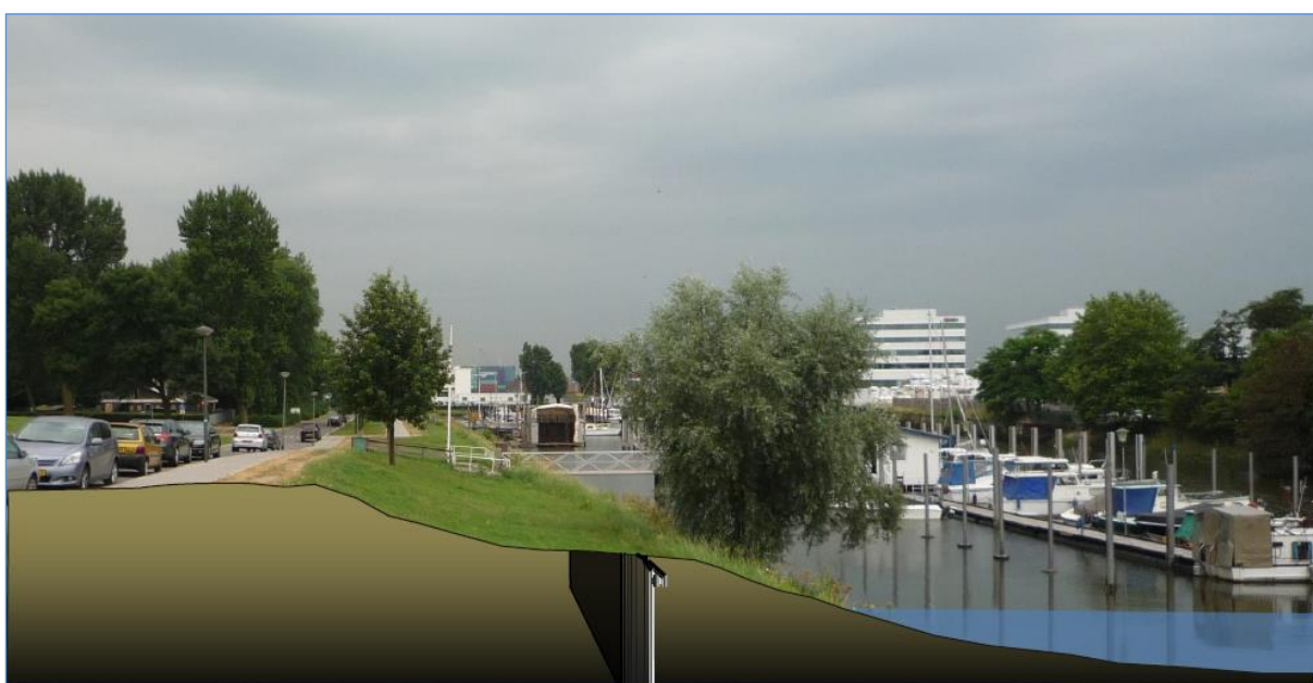
Figuur 2 Impressie situatie na uitvoering verbetermaatregelen (voorkeursvariant 1a).

De keuze voor de stalen damwand (variant 1a) is op basis van bovenstaande argumentatie door de verenigde vergadering van 24 april 2014 vastgesteld.