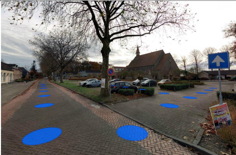
Foto 1 Locatie voorstel