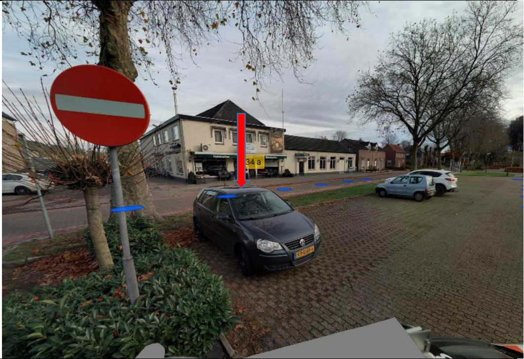
Foto 2 locatie voorstel