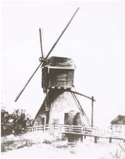
Figuur 2: De oude watermolen

De maalvliet is een eeuwenoude afwatering van de polder Rapijnen met de Korte Linschoten, mogelijk al in de 13 e eeuw gegraven. Het water voerde via het Grootwaterschap van Woerden (via de Korte Linschoten en de Oude Rijn) af.