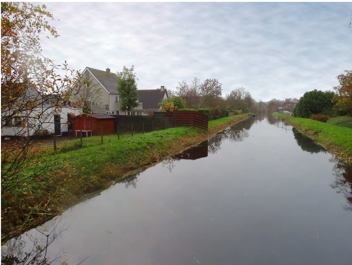
Figuur 3: Foto bestaande groene kade ten westen van Laan van Overvliet

De huidige kade vertoont op diverse locaties erosie van het buitentalud. Daarnaast is schade aan de kade vastgesteld ten gevolge van graverij door muskusratten.