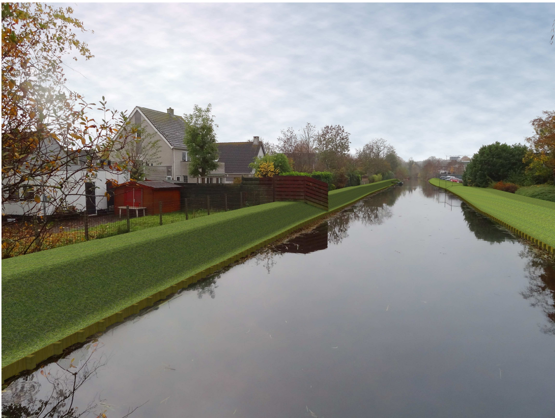
Figuur 5: Artist impression toekomstige situatie

Op twee locaties kan geen principe oplossing worden toegepast. Behalve de al genoemde locatie bij "De Goederen" is dat bij de groothandel op het industrieterrein in vak 212-II.