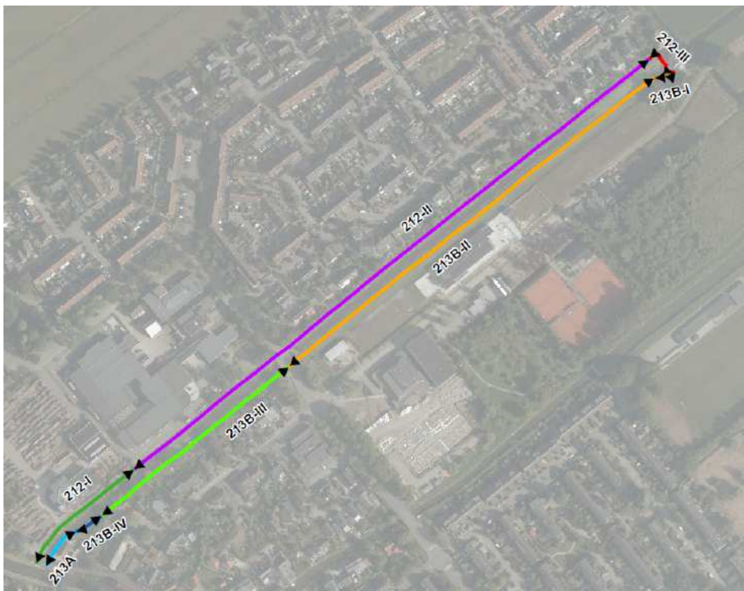
Figuur 1: Ligging kaden met vakverdeling in Linschoten

De voorboezem Rapijnen is een voorboezem (afwateringskanaal tussen gemaal en boezemwater), welke afwatert op de Korte Linschoten. De voorboezem is gelegen in het centrum van Linschoten in de gemeente Montfoort, zie figuur 1.