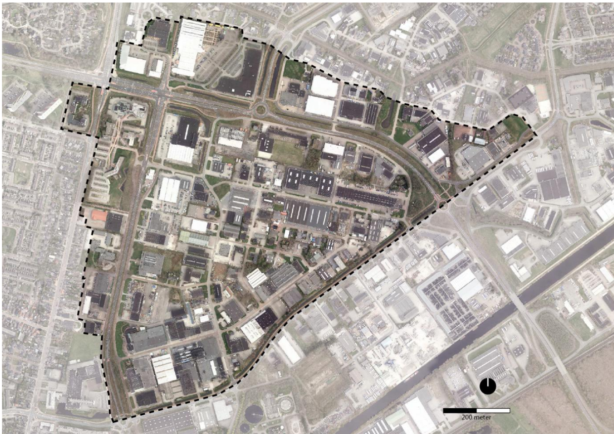
Projectgebied Revitalisering Stadsbedrijvenpark

In het project Revitalisering Stadsbedrijvenpark is de ruimtelijke kwaliteit van panden en erven een van de belangrijke thema's. Onderdeel van het Revitaliseringsplan is een subsidieregeling voor gevelrenovatie en de verbetering van voorerven.