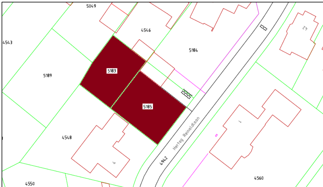
Kadastrale weergave plangebied (rood gearceerd)