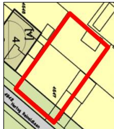
Uitsnede verbeelding "Peelkernen"

De voor "Wonen" aangewezen gronden zijn onder andere bestemd voor woningen in de categorieën: vrijstaande woningen, dubbele woningen, rijwoningen en gestapelde woningen. Voor hoofdgebouwen geldt dat deze binnen het op de verbeelding aangegeven bouwvlak dienen te worden gebouwd. De voor "Tuin" aangewezen gronden zijn onder andere bestemd voor tuinen en een inrit.