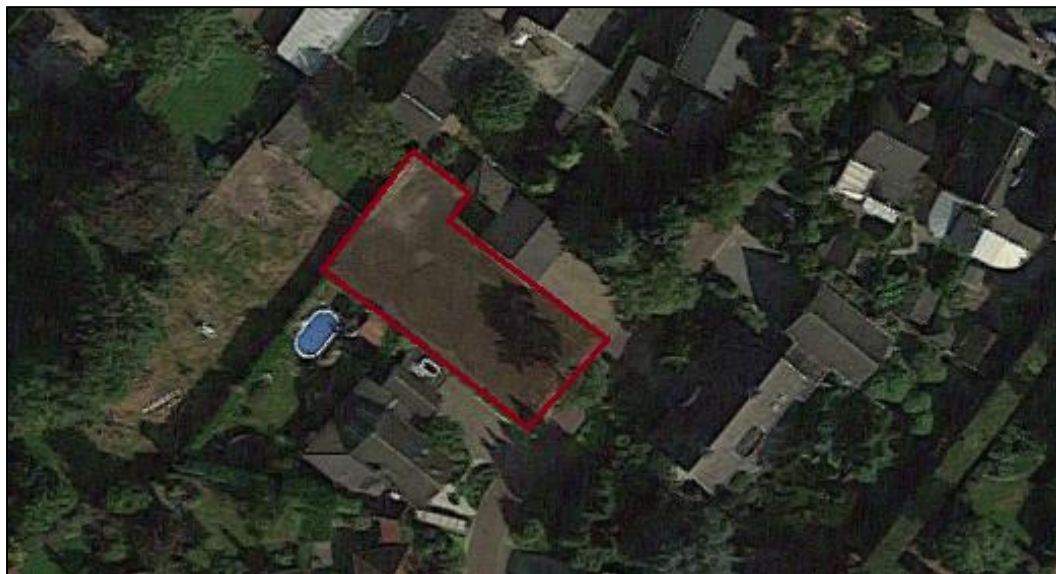
Luchtfoto plangebied (rood omlijnd) en directe omgeving

Het plangebied ligt ten zuidoosten van de kern Horst, in de gemeente Horst aan de Maas en bestaat in de huidige situatie uit een braakliggend terrein.