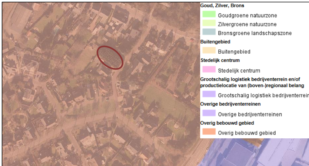
POL2014-kaart "Zonering Limburg" met aanduiding plangebied (rood omcirkeld)

Op 12 december is het Provinciaal Omgevingsplan 2014 (POL2014) vastgesteld als opvolger van het POL2006. In het POL2014 is onderscheid gemaakt in zeven soorten gebieden, elk met eigen herkenbare kernkwaliteiten. Voor de verschillende zones liggen er heel verschillende opgaven en ontwikkelingsmogelijkheden.