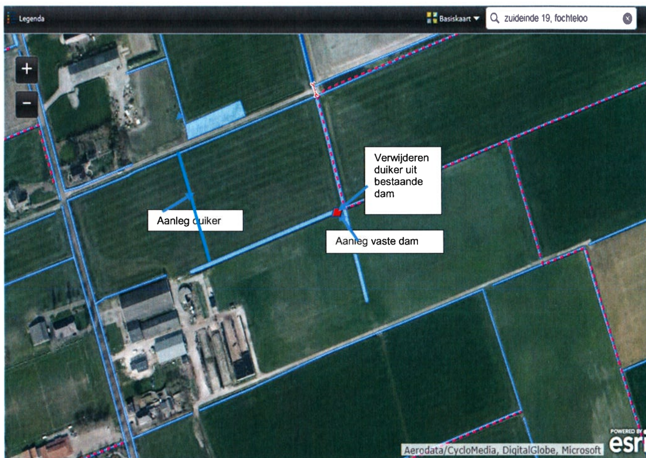
Figuur 1. Ligging plangebied en maatregelen

Het plangebied ligt ten noorden van Zuideinde 19, ten oosten van de weg Zuideinde en ten westen van de Vogelrijd.