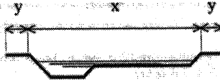
BOVENAANZICHT EN DWARSDOORSNEDE VAN WATER MET BESCHERMINGSZONE