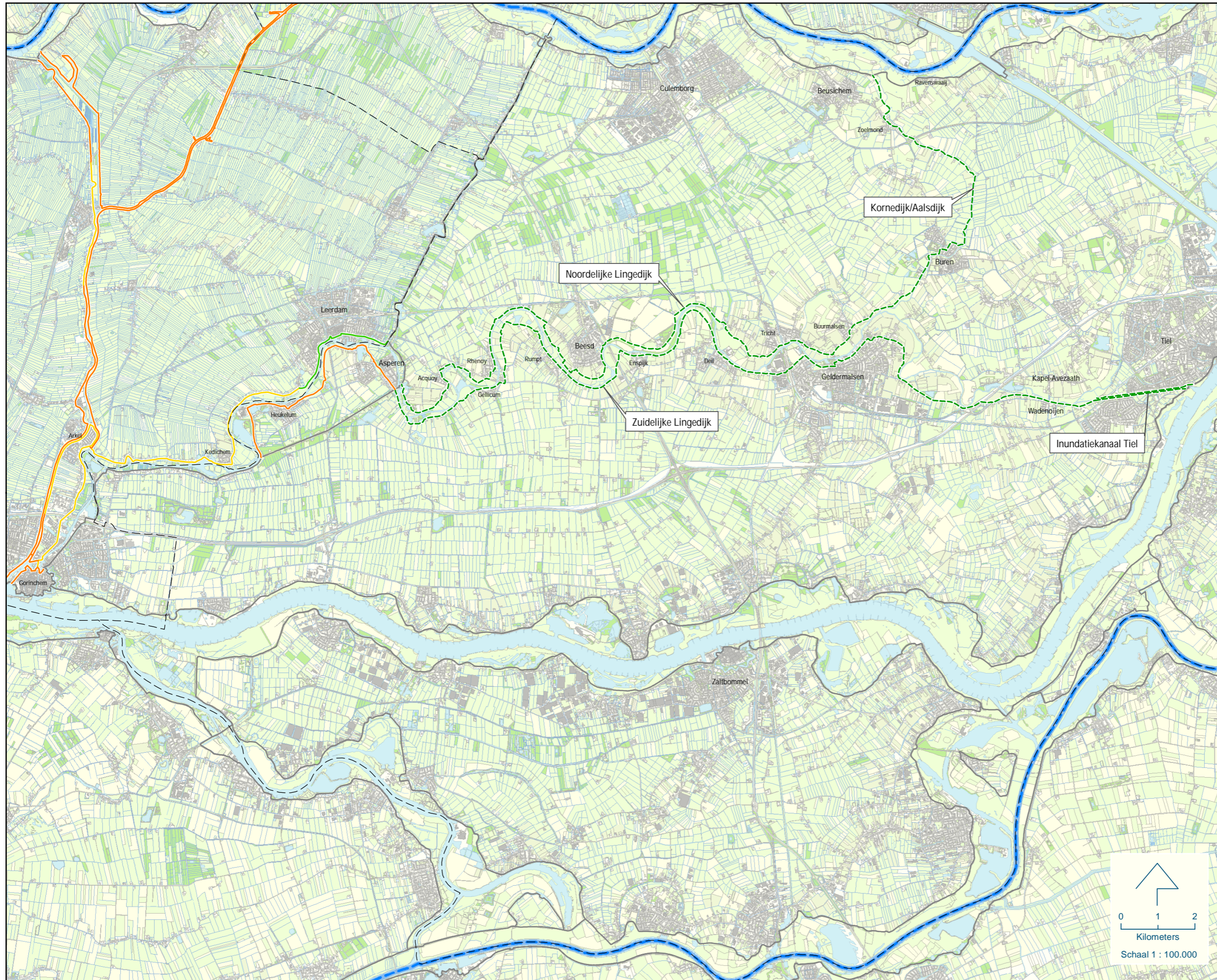
Bijlage 1: Kaart regionale waterkeringen als bedoeld in artikel 2.1 en 2.2 van de Waterverordening waterschap Rivierenland : deel 2