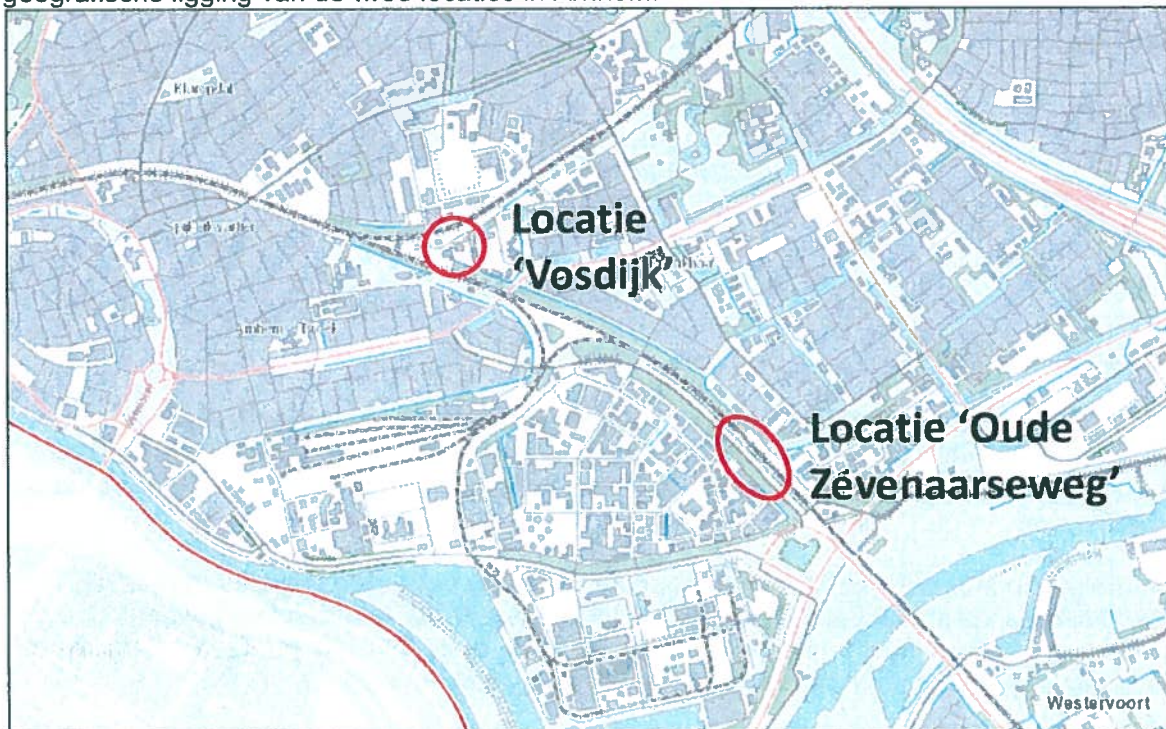
Figuur 1 Globale ligging projectlocaties

De locaties worden nader aangeduid onder de namen 'Vosdijk' (watergang LV24230012) en 'Oude Zevenaarseweg' (LV24220079). Onderstaande figuur 1 is een weergave van de geografische ligging van de twee locaties in Arnhem.