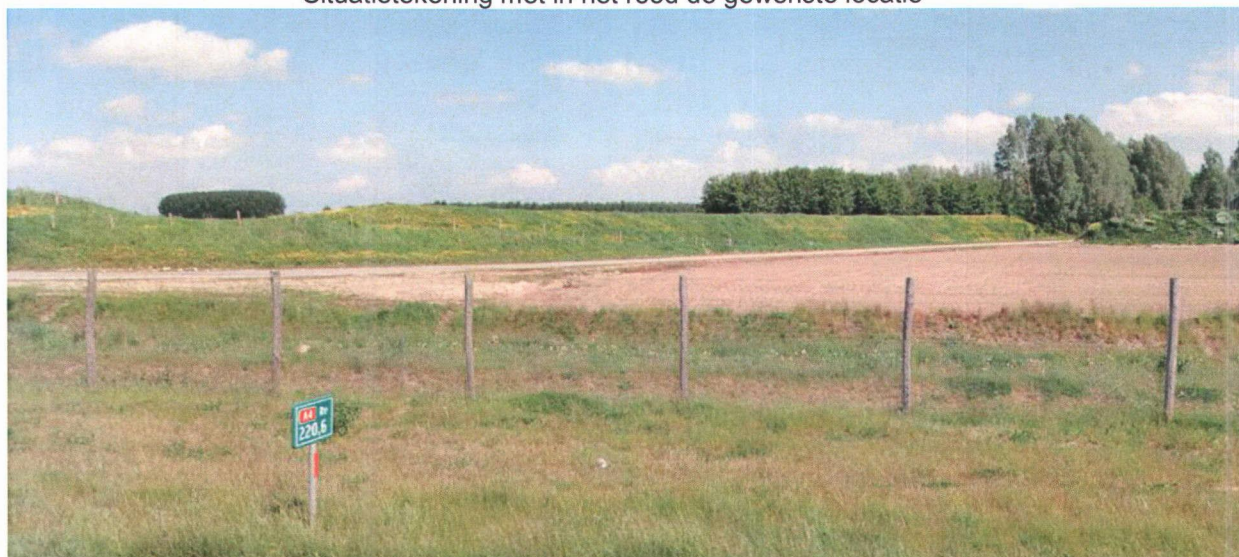
Foto van de bestaande situatie