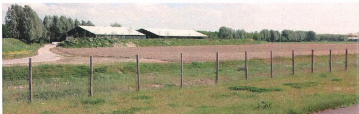
Foto van de bestaande situatie