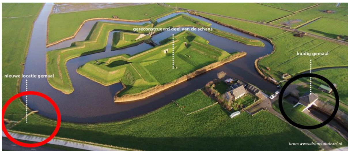
Afbeelding 2 – Ligging huidig en vervangend gemaal. Ligging volgens ontwerp projectplan is zwart omrande cirkel; alternatieve locatie voor vervangend gemaal is rood omrande cirkel.

Als het hoogheemraadschap gemaal De Schans kan herbouwen op de nieuwe locatie – deze ligt in de rode cirkel van afbeelding 2 – heeft dat voor de door het hoogheemraadschap te verzorgen waterbeheersing op Texel het voordeel dat het gemaal in het verlengde van de aanvoersloot komt te liggen. Het weg te pompen water stroomt dan in een rechte lijn naar het nieuwe gemaal. Dit maakt ook mogelijk dat het huidige gemaal tijdens de bouw van het nieuwe in gebruik kan blijven tot het nieuwe gemaal is opgeleverd en het hoogheemraadschap het in bedrijf stelt. Het voorkomt dat het hoogheemraadschap een tijdelijke pompinstallatie moet plaatsen, die haar functie tijdelijk zou moeten overnemen.