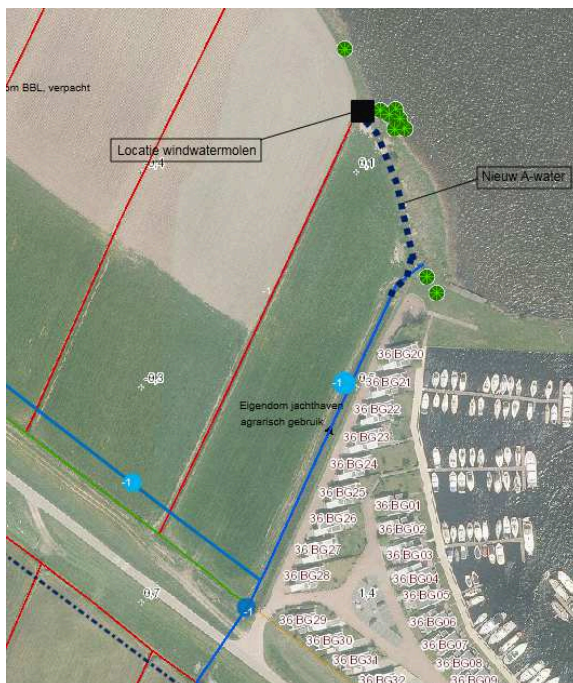
Figuur 2. Maatregelen uit dit projectplan: zie kaders 'Locatie windwatermolen' en 'Nieuw A-water'