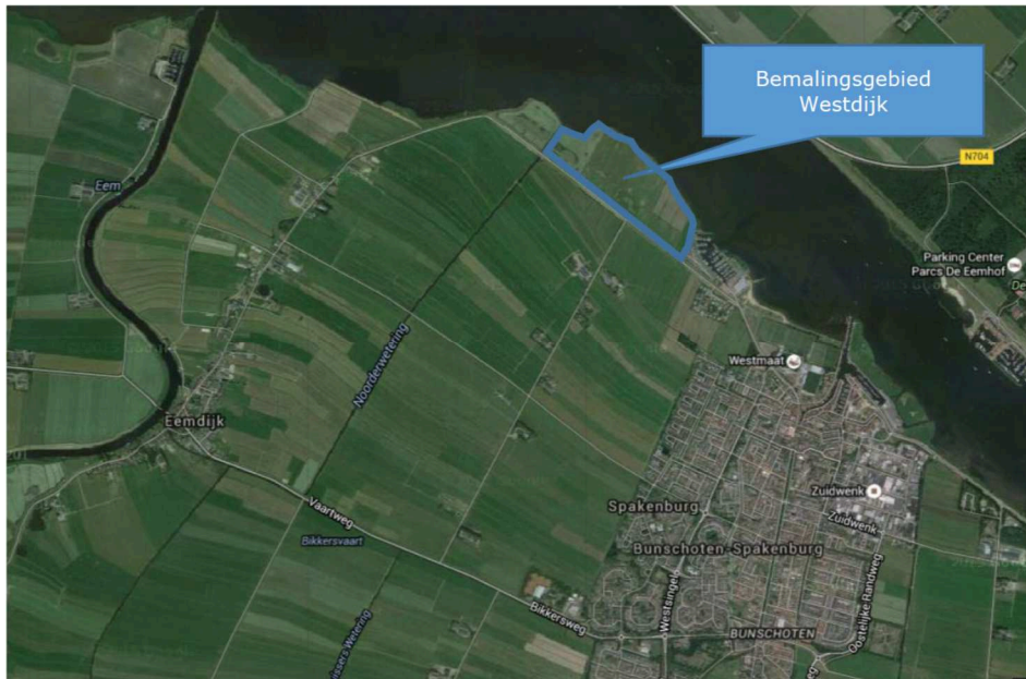
Figuur 1: Lokatie van het buitendijks gelegen gebied langs de Westdijk te Bunschoten (ca 20 ha)